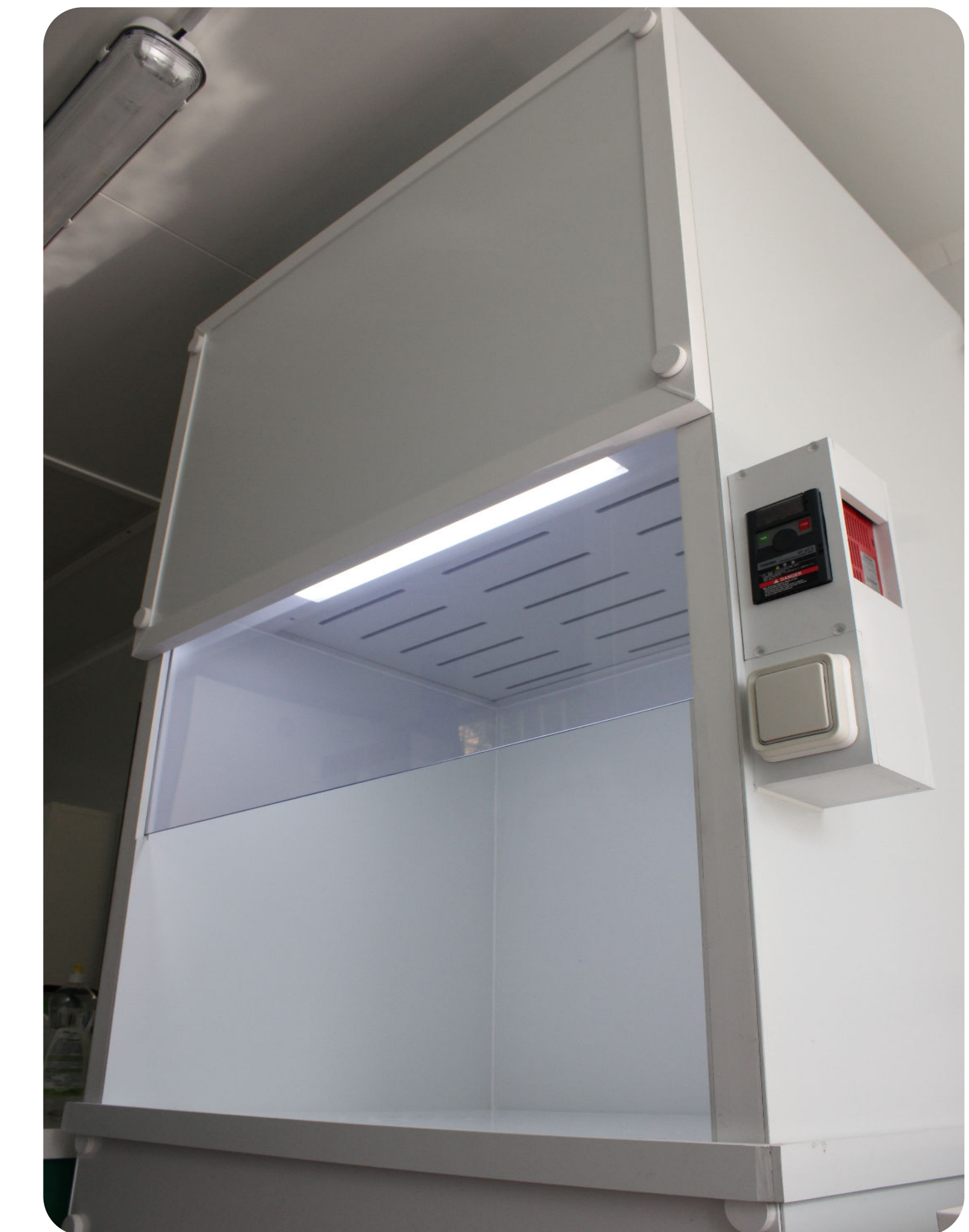
Hotte à flux laminaire

ALSAPLAST TEAM met ici en avant sa force de créer, sur-mesure et de façon constante, des produits répondant aux besoins du client. Le cahier des charges précis donné par le client est scrupuleusement étudié par l'ensemble des collaborateurs. En accord avec le client, chaque projet est validé individuellement pour le rendre unique et propre. S'en suit la partie conception par Alsaplast Team pour rendre le projet du client concret.