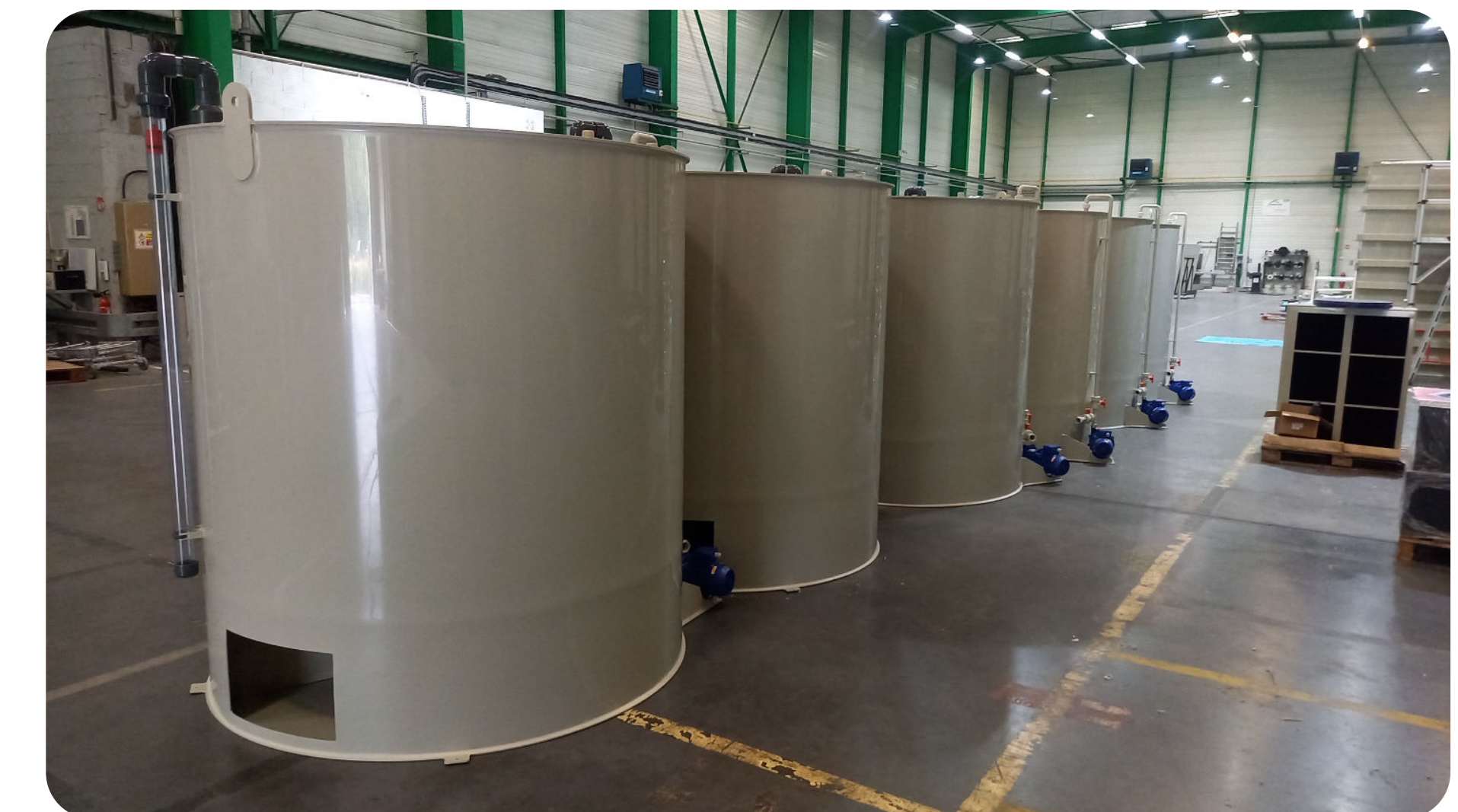
Cuves verticales à fonds coniques

Nous intervenons dans la fabrication des cuves de traitements (désinfection, équilibre du pH, filtration, coagulation et floculation), des systèmes de décantations (décanteur lamellaire ou statique, épaisseur) et des réseaux de tuyauteries de connexion et de transfert entre ces équipements. Lorsque ces effluents ne peuvent pas être traités sur place, nous réalisons les cuves nécessaires au stockage avant rempotage par camion.