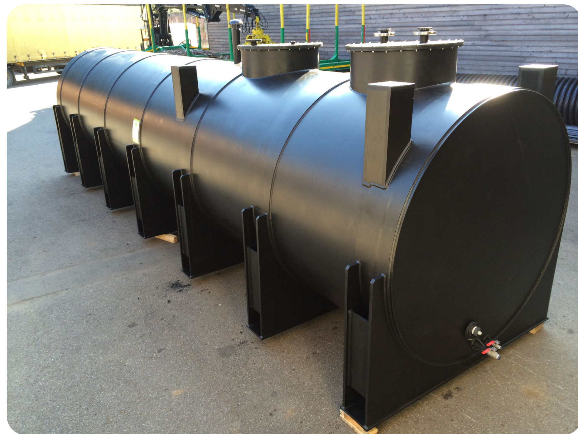
Cuve cylindrique horizontale

ALSAPLAST TEAM est également présent dans la partie traitement des eaux usées industrielles.