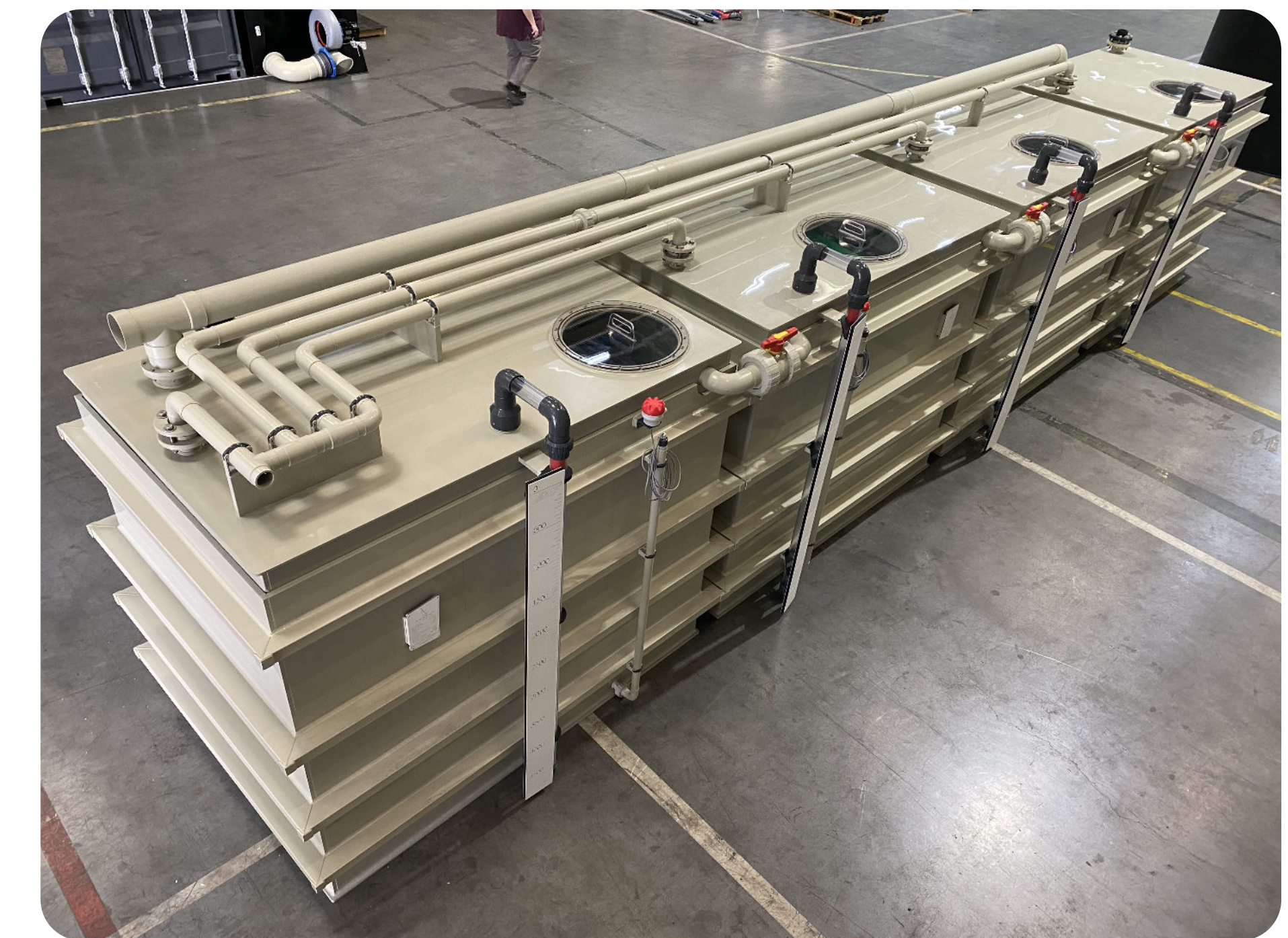
Bac de traitement