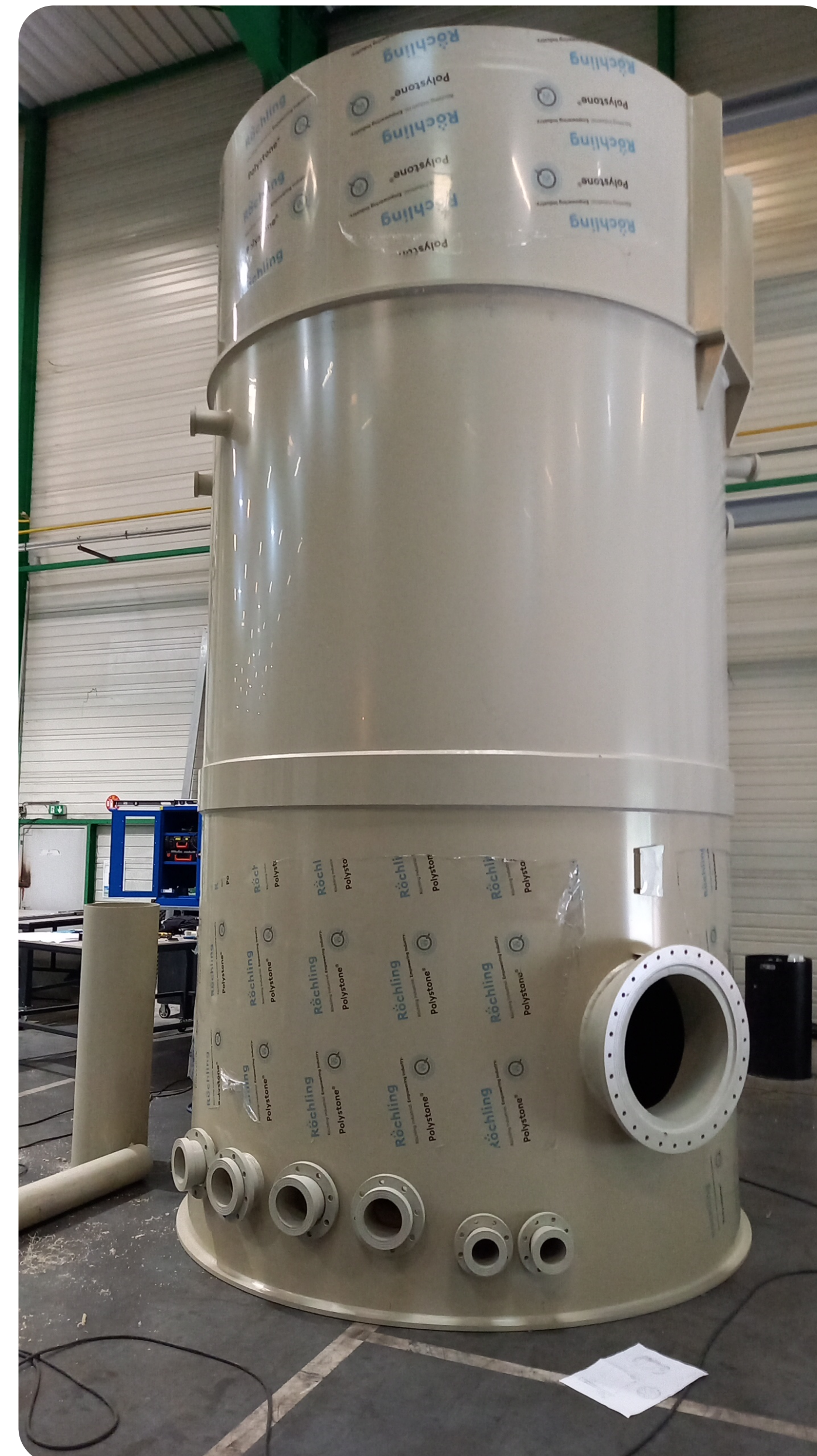
Cuve cylindrique verticale